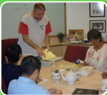
CLIM들이 모여서 준비회의를 합니다.