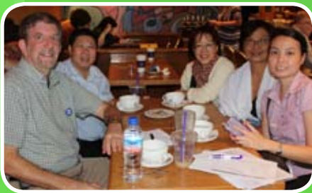
싱가포르의 CLIM 자원봉사자들이 다음 전도기회를 잡기 위해 만났습니다.

http://jewsforjesus.org/publications/newsletter/2005_10/colaborer