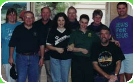
시드니 모임이 모이는 것을 기뻐하고 나가서 전도하려 합니다.

어떤 젊은 보수 유대인 남자가 채팅방으로 들어와서, 예수님이 메시아인 것을 점점 더 확신한다고 말했습니다. 대화 도중에 그는 다른 사람들과 히브리어로 말했고, 제가 히브리어를 좀 더 알았으면 좋겠다고 말하자, 그는 "당신이 내게 예수님을 가르친다면 내가 당신에